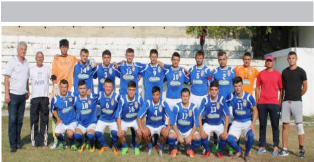
Echipa de fotbal „Fulger” din Ialoveni

La eveniment au participat elevii claselor mici din cele patru instituții de învățământ din Ialoveni. Festivalul a fost organizat cu suportul Oficiului Regional de Dezvoltare al Federației Moldovenești de Fotbal, regiunea Centru. Copiii au participat activ la diferite exerciții și au jucat fotbal.